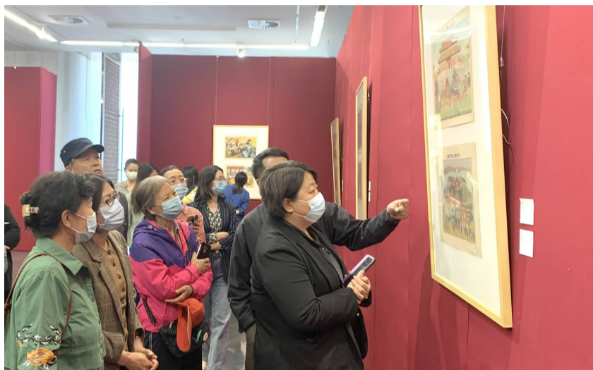
广外南社区党员参观“非凡年代—庆祝中国共产党成立100周年”年画连环画宣传画特展