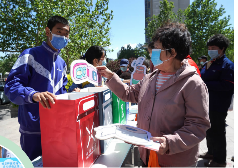
九龙南社区居民参与垃圾分类游戏