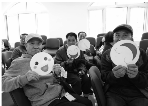
残疾朋友展示自己书写的祝福

“我们‘心智呼唤’服务主要是通过入户心理疏导、心理讲堂、助医、生活安全讲解等方面,对双井地区30户心智障碍者家庭提供服务。”工作人员介绍道。心智障碍者家庭面临的不仅是心智障碍者本身需要家庭照料和抚养所带