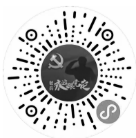
扫描小程序参与答题