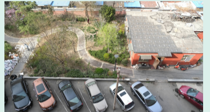
现有空间划分可容纳的车位少