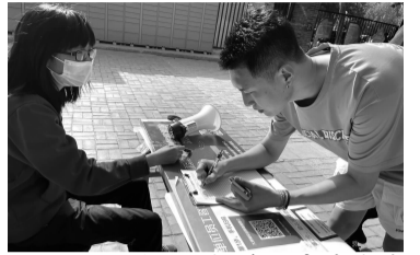
居民现场登记疫苗接种