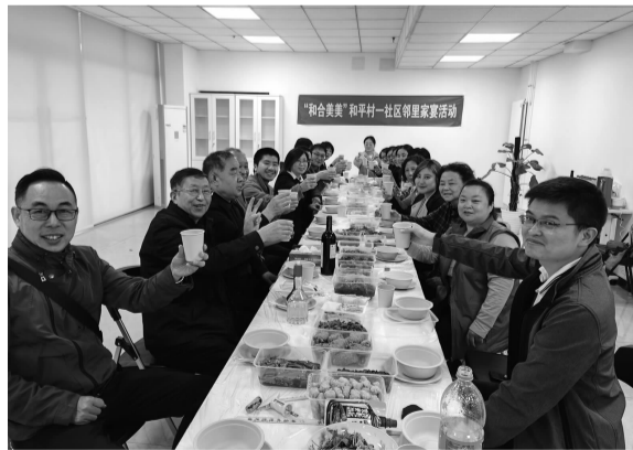
居民们举杯庆祝邻里宴

清蒸鱼、宫保鸡丁、咖喱牛肉……一道道家常菜，冒着腾腾热气，泛着诱人的色泽，散发出扑鼻香气，纷纷被端上了餐桌。小区居民们聚在一起，品尝美食，评点交流，享受舌尖上的快感，感受邻里间的温馨！活动中，和平村一