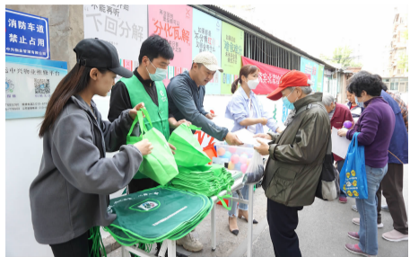
双花园社区向居民发放垃圾分类纪念品及宣传单