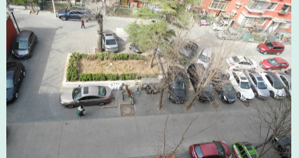
小区配套设施不足