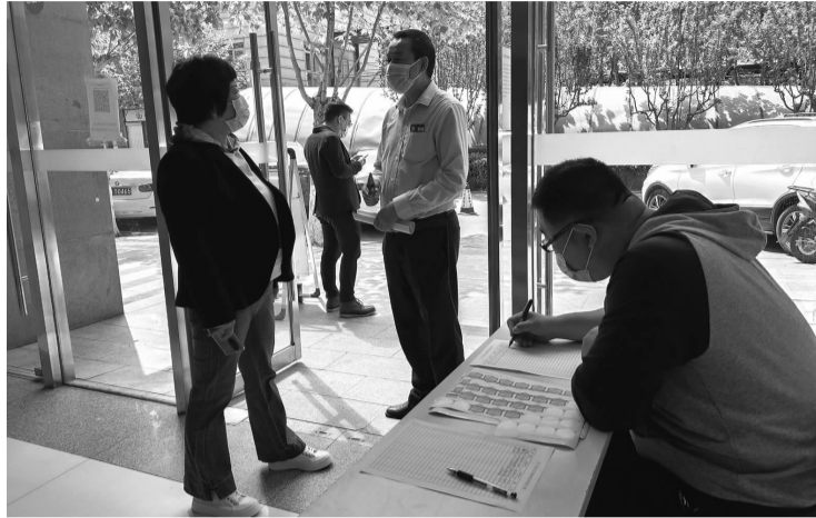
社区工人了解商务楼宇疫苗接种情况

除此之外,5月11日-5月16日在双井辖区疫苗接种点接种第一针疫苗的人员,可以凭双井街道第一针注射凭证(《知情同意书》)至北京朝阳合生汇L1服务台领取55元合生汇无门槛代金券,数量有限。领取人需未在双井地区其他商市场举办的类似活动中领取过相关物品。