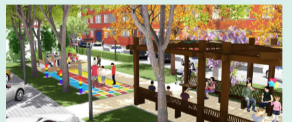
优化场地植物配置,增加体育健身设施