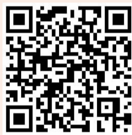
扫码了解百年征程

为了庆祝中国共产党建党100周年，我们剪辑了这个会动的“相册”，希望能用这样的形式让更多人了解党史，普及知识。