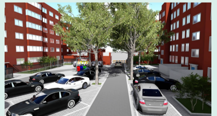
调整功能分区,创造良好人居环境