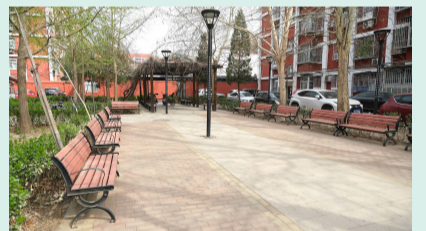
场地空旷无明显功能分区