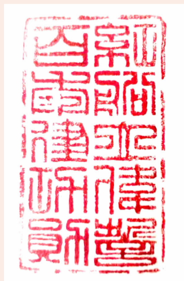
“红船立伟誓 百年建功勋”印章

1921年，中共一大在上海召开，后来受反动势力影响被迫转移到南湖红船上举行。我们的党员从当时的十几个人发展到现在9191.4万名（截止到2019年12月，来源于中央新闻），这期间中国共产党经历了艰苦卓绝的奋斗，经历了抗日战争、解放战争，正如毛主席所说的星星之火可以燎原，这在世界历史上也是很少有的。我作为一位老党员与党一起成长，感到无比的自豪、荣幸。我深感觉党的伟大，因此特意创作印章向党表达我的赞美之意。