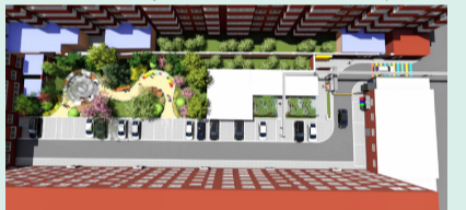
规范停车管理,促进有序社区建设。