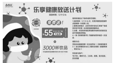
接种新冠疫苗可享专属福利